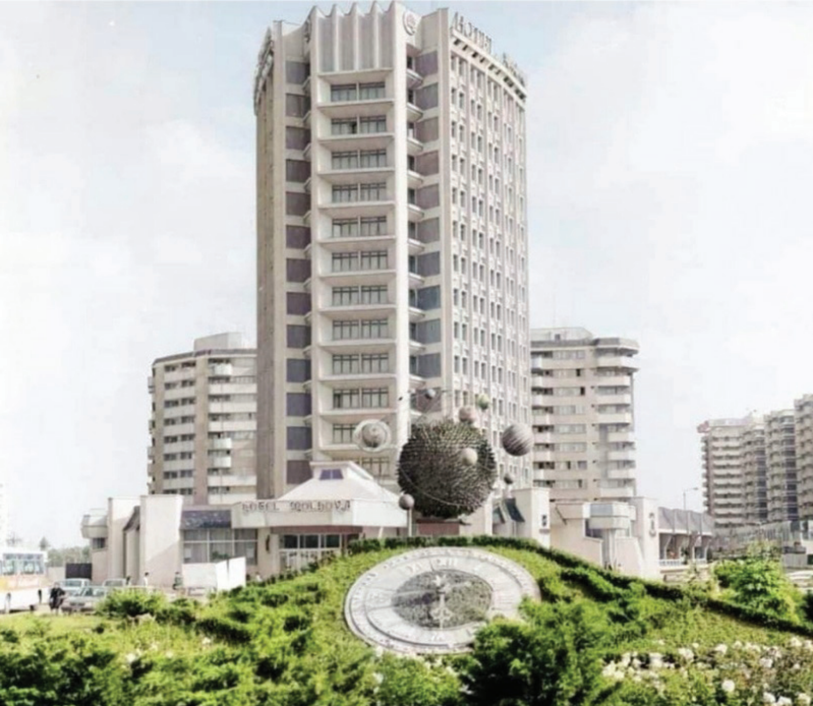
Bacău, Grădina Publică